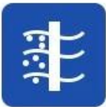
Sea water desalination