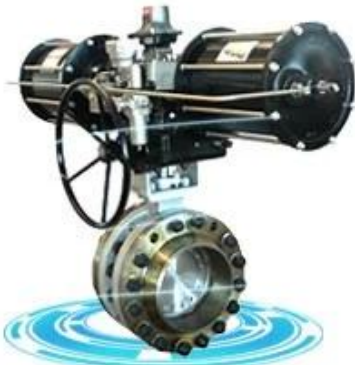
Triple offset butterfly valve