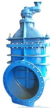
RKS SMALL DIAMETER GATE VALVE DN50 - DN300, PN10 / 16 /25