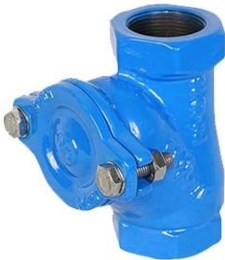
Ball Check Valve, Threaded