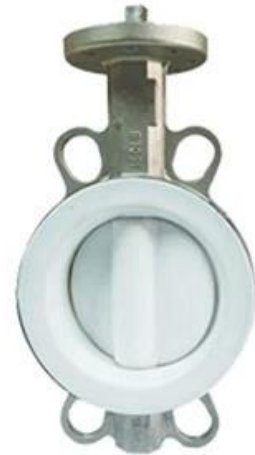
PTFE Butterfly Valve