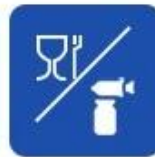
Food and drug