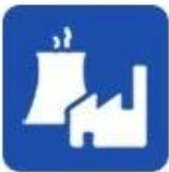
Industrial water application