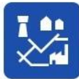
Water supply and drainage