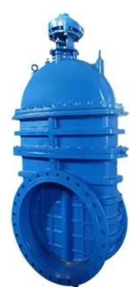
LARGE DIAMETER METAL SEATED GATE VALVE DN700-DN2000,PN10/16/25