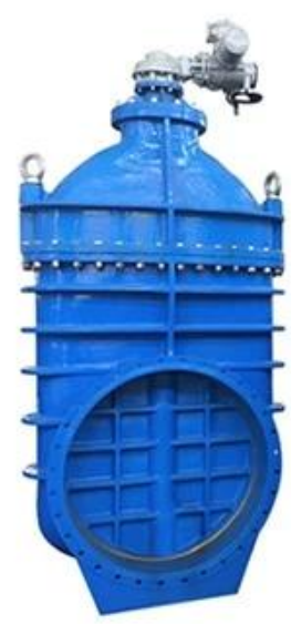
METAL SEATED GATE VALVE DN350-DN600,PN10/16/25