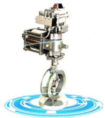
Double offset butterfly valve