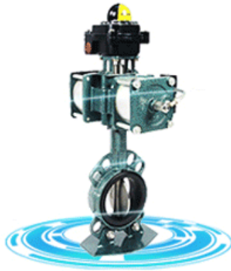
Resilient seat butterfly valve