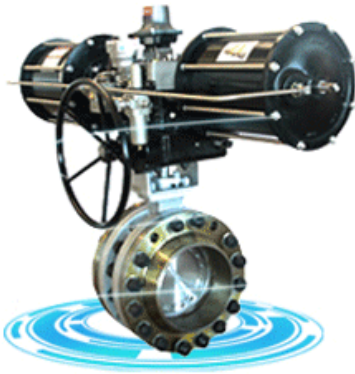
Triple offset butterfly valve