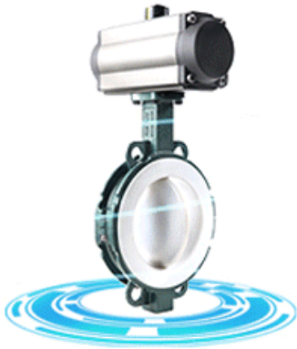
PTFE lined butterfly valve