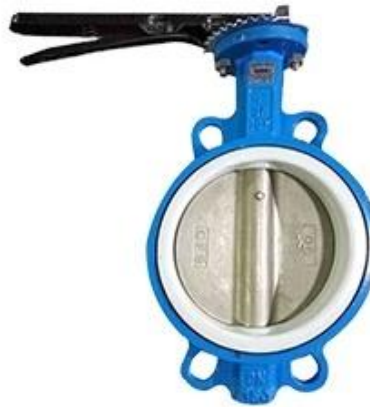
PTFE Butterfly Valve