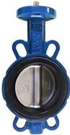
Resilient seat butterfly valve