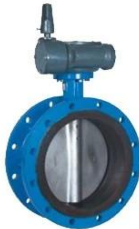
Double flange resilient seat butterfly valve