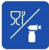
Food and drug