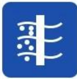
Sea water desalination