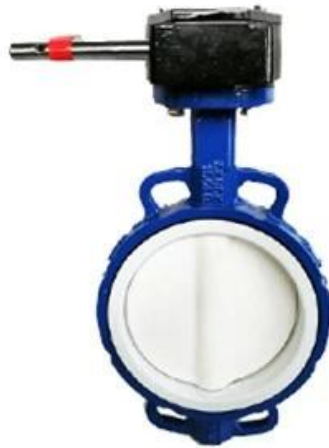
PTFE Butterfly Valve