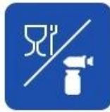
Food and drug