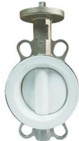
PTFE Butterfly Valve