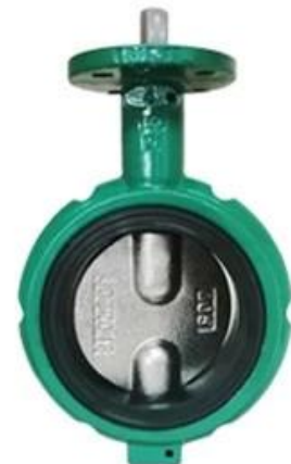
Short-neck butterfly valve for petroleum