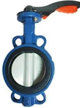
Resilient seat butterfly valve