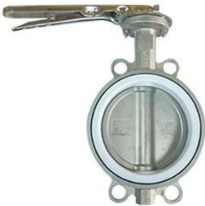
PTFE Butterfly Valve