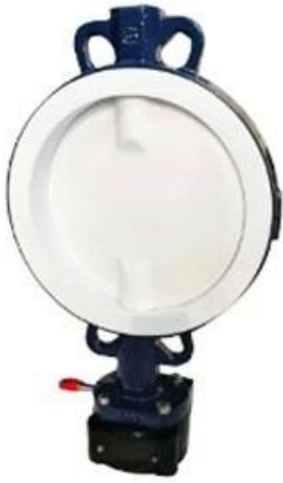
PTFE Butterfly Valve