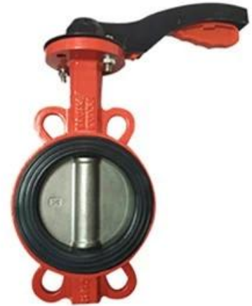
Resilient seat butterfly valve