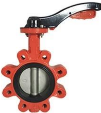
Resilient seat butterfly valve