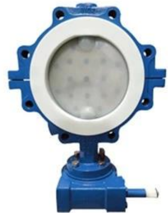
PTFE Butterfly Valve