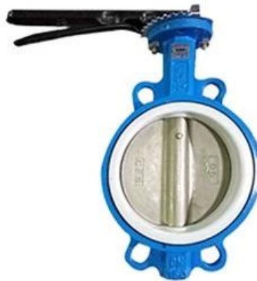
PTFE Butterfly Valve