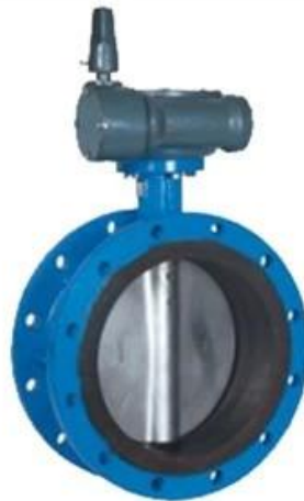
Double flange resilient seat butterfly valve