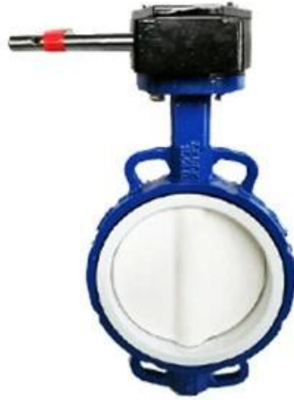
PTFE Butterfly Valve