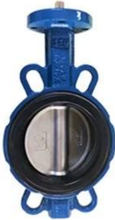
Resilient seat butterfly valve