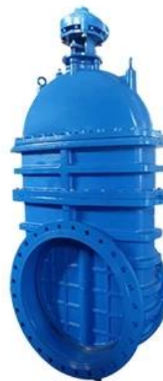
LARGE DIAMETER METAL SEATED GATE VALVE DN700-DN2000,PN10/16/25