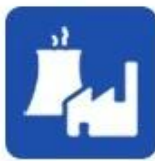
Industrial water application