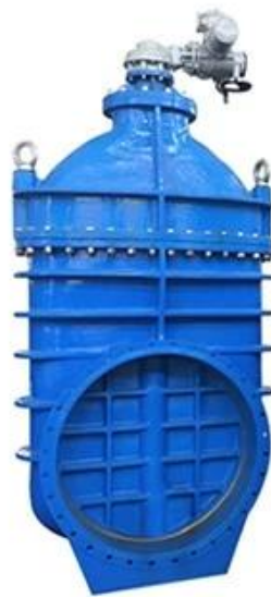
METAL SEATED GATE VALVE DN350-DN600,PN10/16/25