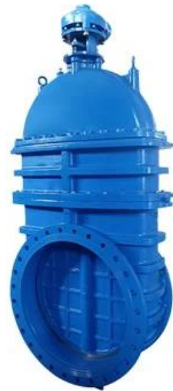
LARGE DIAMETER METAL SEATED GATE VALVE DN700-DN2000,PN10/16/25