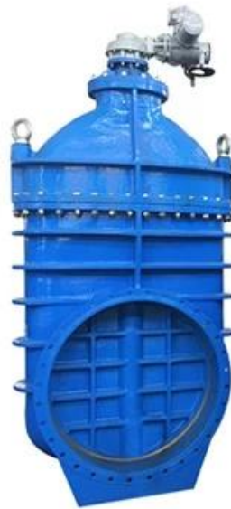
METAL SEATED GATE VALVE DN350-DN600,PN10/16/25