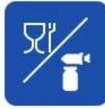
Food and drug