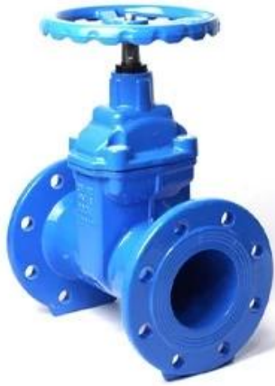
SMALL DIAMETER GATE VALVE DN50-DN300,PN10/16/25