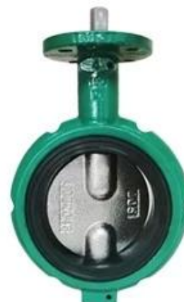
Short-neck butterfly valve for petroleum