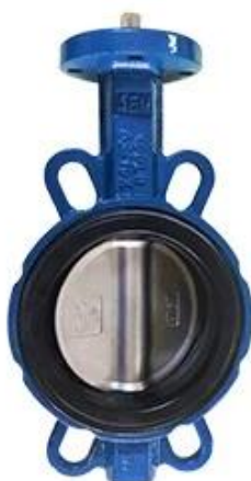
Resilient seat butterfly valve