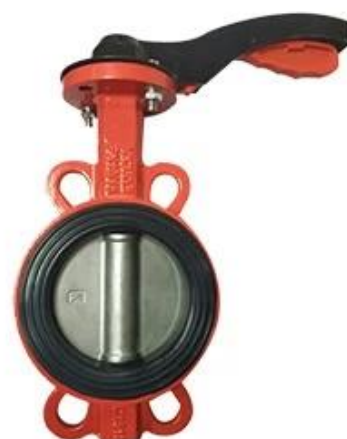
Resilient seat butterfly valve