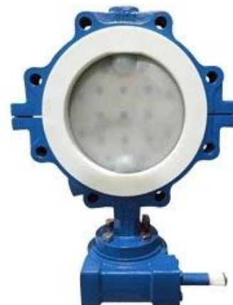
PTFE Butterfly Valve