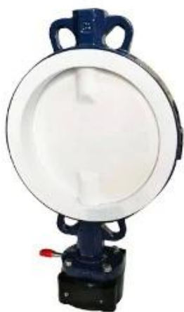
PTFE Butterfly Valve