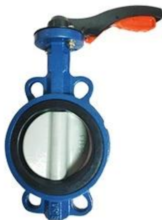
Resilient seat butterfly valve