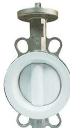
PTFE Butterfly Valve