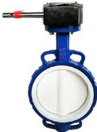
PTFE Butterfly Valve