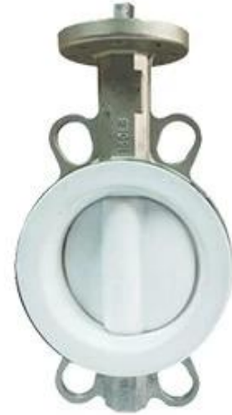
PTFE Butterfly Valve