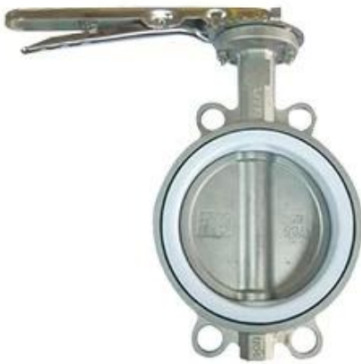
PTFE Butterfly Valve