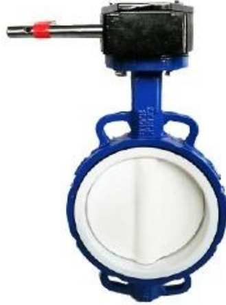
PTFE Butterfly Valve