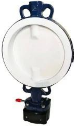
PTFE Butterfly Valve