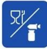
Food and drug