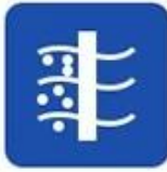
Sea water desalination