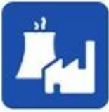
Industrial water application