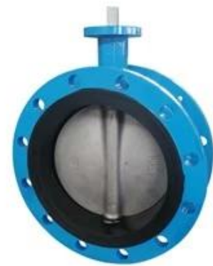
Double flange resilient seat butterfly valve