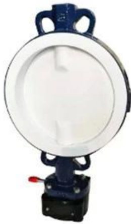
PTFE Butterfly Valve