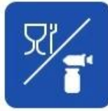
Food and drug