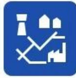
Water supply and drainage