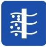
Sea water desalination