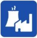
Industrial water application