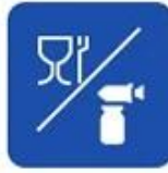
Food and drug