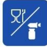
Food and drug