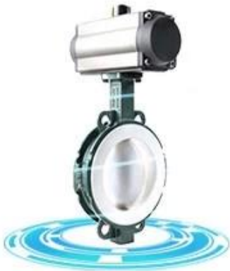
PTFE lined butterfly valve