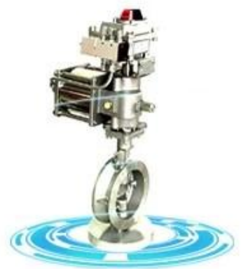
Double offset butterfly valve