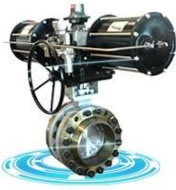
Triple offset butterfly valve