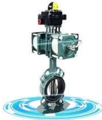
Resilient seat butterfly valve