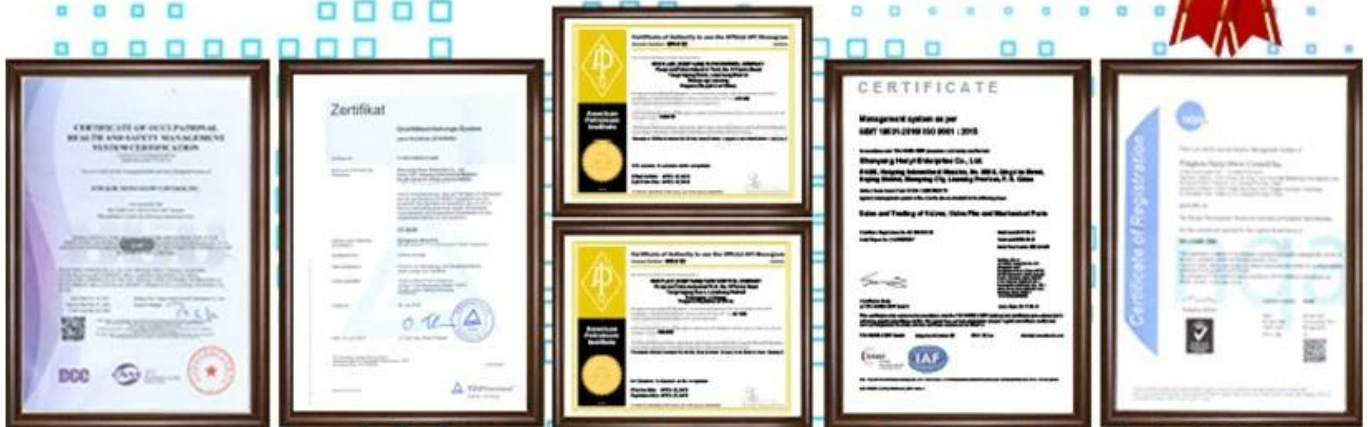
圖 冊 圖 冊