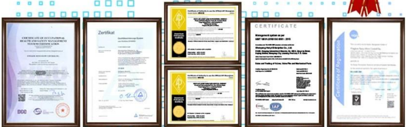
圖 冊 圖 冊