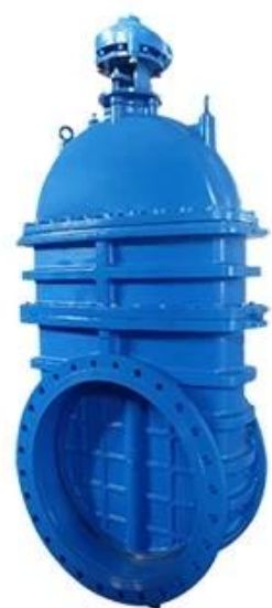
LARGE DIAMETER METAL SEATED GATE VALVE DN700-DN2000,PN10/16/25