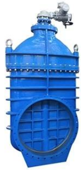
METAL SEATED GATE VALVE DN350-DN600,PN10/16/25