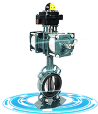
Resilient seat butterfly valve