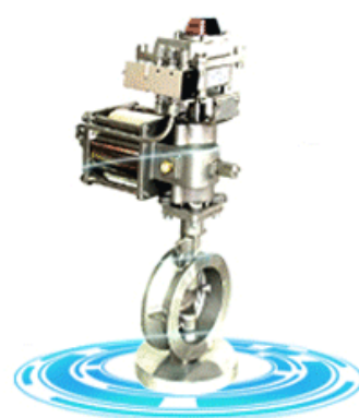
Double offset butterfly valve