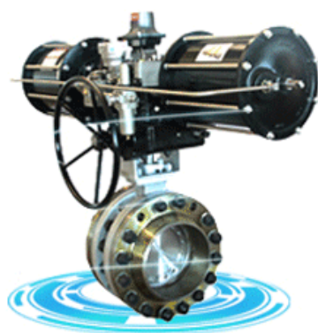
Triple offset butterfly valve