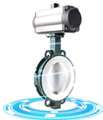
PTFE lined butterfly valve