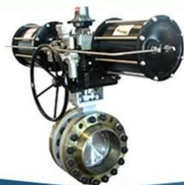
Triple offset butterfly valve