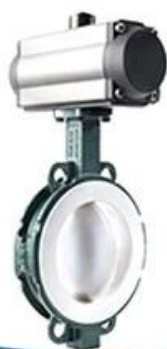
PTFE lined butterfly valve