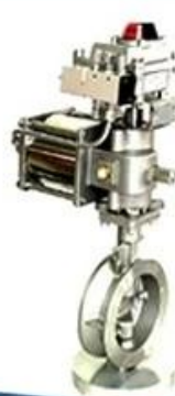
Double offset butterfly valve