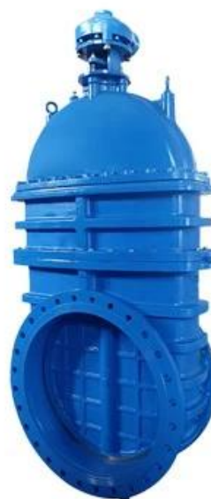
LARGE DIAMETER METAL SEATED GATE VALVE DN700-DN2000,PN10/16/25