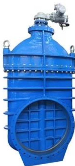
METAL SEATED GATE VALVE DN350-DN600,PN10/16/25