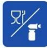
Food and drug