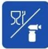
Food and drug