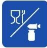
Food and drug